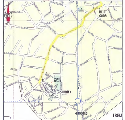
STRATENPLAN Schaal: 1/1.000

Grenzen op basis van het opmetingsplan van de Landmeter-expert handtegend voor S.B.V. bvba, Kasteelstraat 8, 2200 Groot-Sondrik, Landmeter P. Verbeke (LAN 040257), Landmeter E. Jacobs (LAN 071312) d.d. 30/10/2018