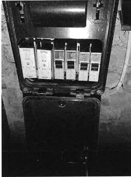
( Elektrisch bord )