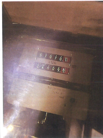
Tableau électrique principal