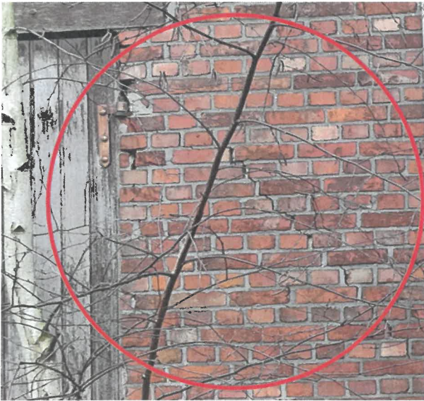
212 gevelementen 2121 balk(en) - beschadiging (3 punten)