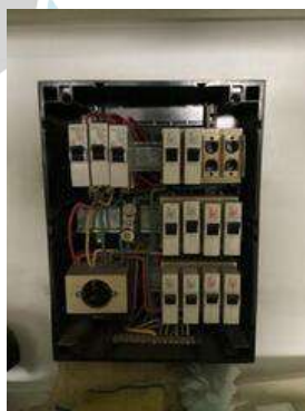
Afbeelding schakel- en verdeelbord: