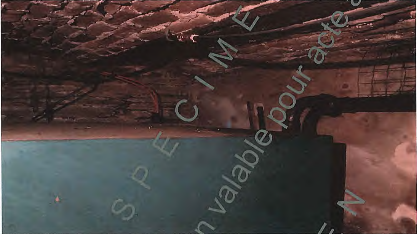
Plaque apposée sur le réservoir