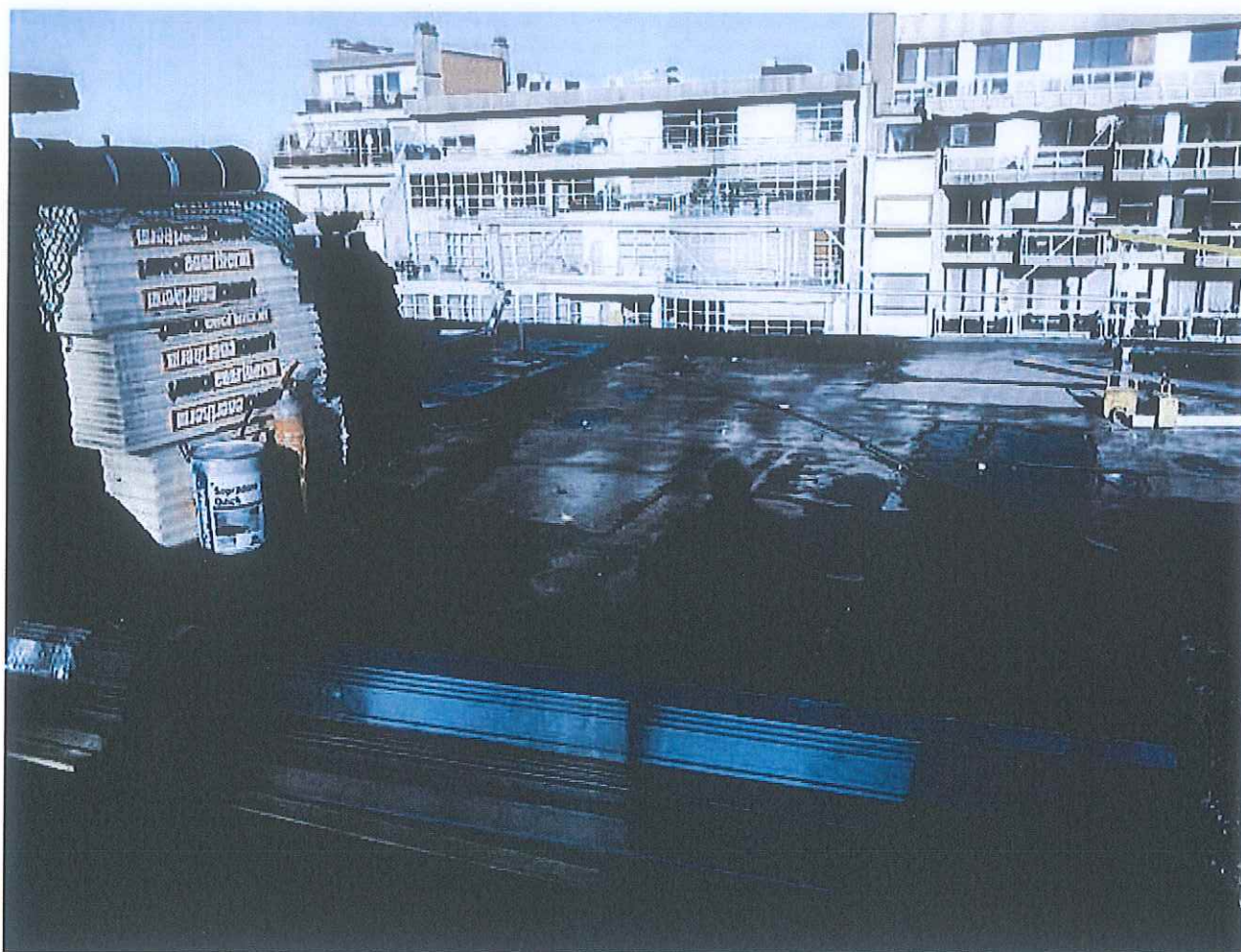
PHOTO DURANT LES TRAVAUX