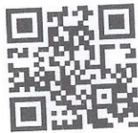
(code QR d'accès immédiat au forum)

Pour toute assistance relative à la compréhension des clauses de ce contrat ainsi que pour le compléter, posez gratuitement vos questions sur le forum online http://forum.pim.be .