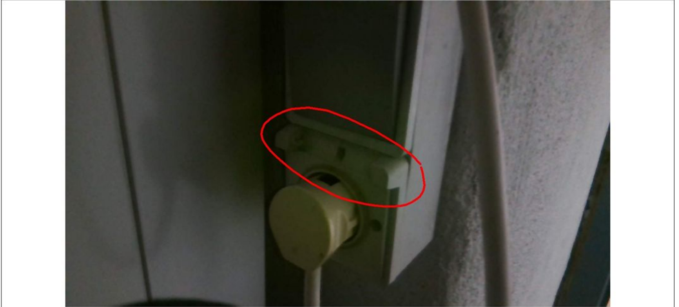
Schéma d'implantation simplifié (Art. 276bis) ou photo/schéma de l'installation (électrique)