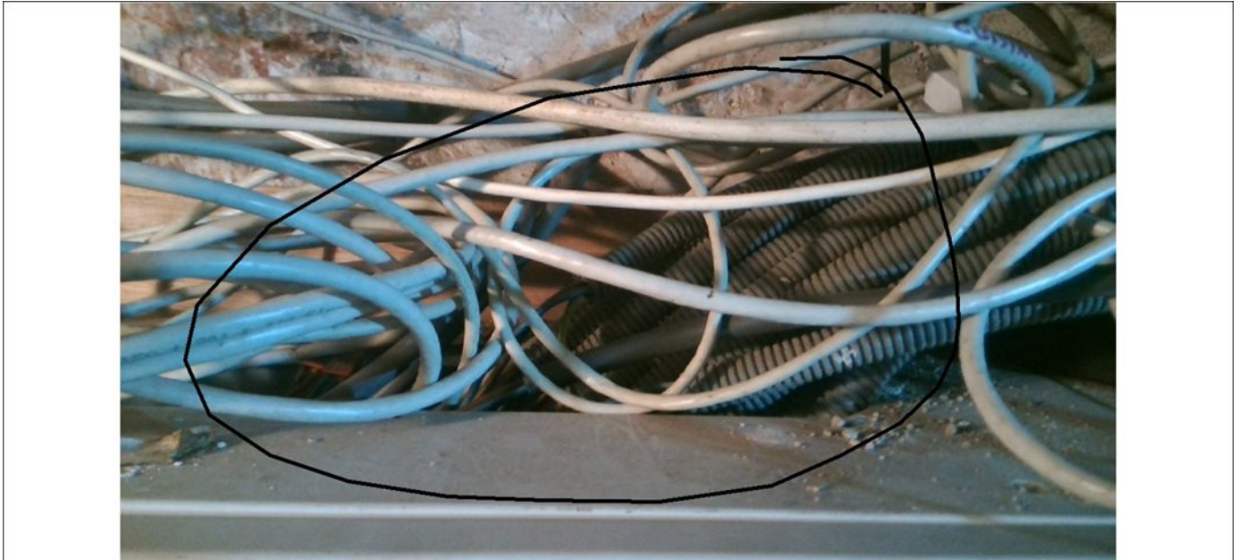
Schéma d'implantation simplifié (Art. 276bis) ou photo/schéma de l'installation (électrique)