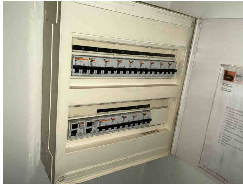
Geen gekoppelde inbreuk