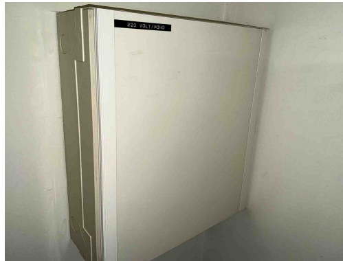
Geen gekoppelde inbreuk