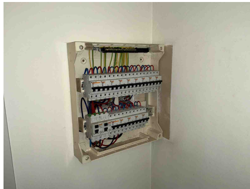
Geen gekoppelde inbreuk

T09 - Bepaalde contactdozen en/of schakelaars zijn beschadigd (Boek 1: 1.4.1.3). Opmerking: Slpk 1