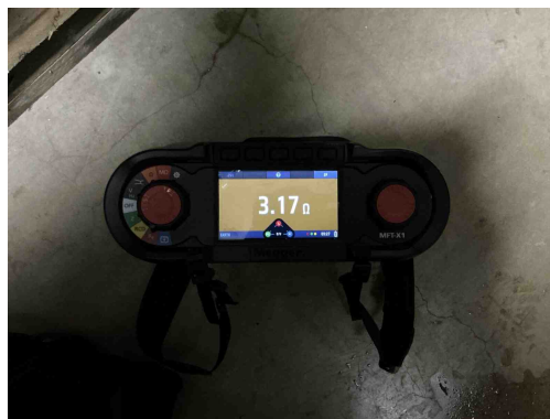
Geen gekoppelde inbreuk