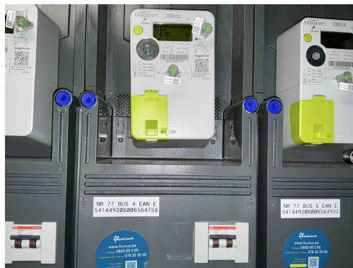
Geen gekoppelde inbreuk