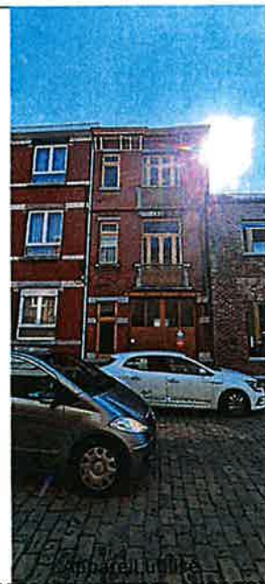
MES015 (METREL MI3100)