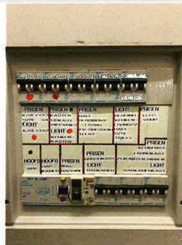
( Uitwendige foto )