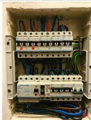
( Inwendige foto )

Aantal differentieelstroominrichtinge 2 n Aantal stroombanen 8