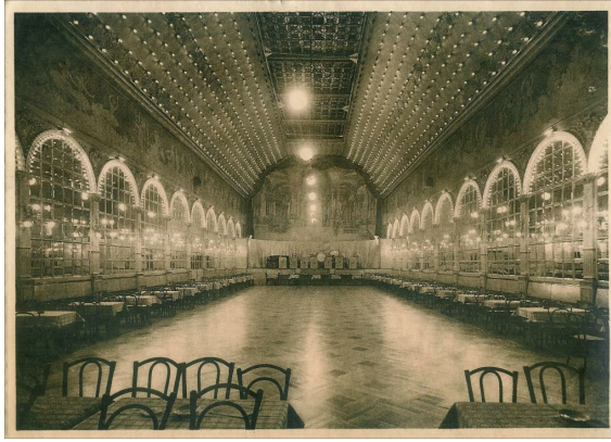
Chaussée d'Anvers, le Palais Baudouin, (coll. Eric Christiaens/Laca)