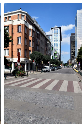
Chaussée d'Anvers, vue vers le nord depuis la rue Nicolay, 2016