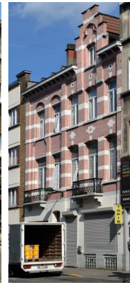
Chaussée d'Anvers 403-405, 2016