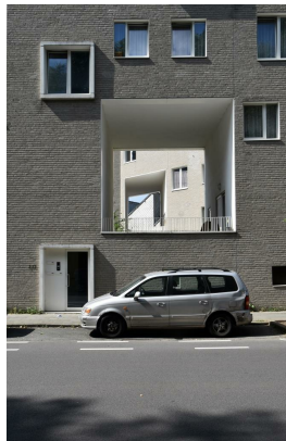
Chaussée d'Anvers 212, 2016