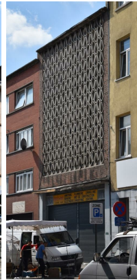
Chaussée d'Anvers 354, 2016