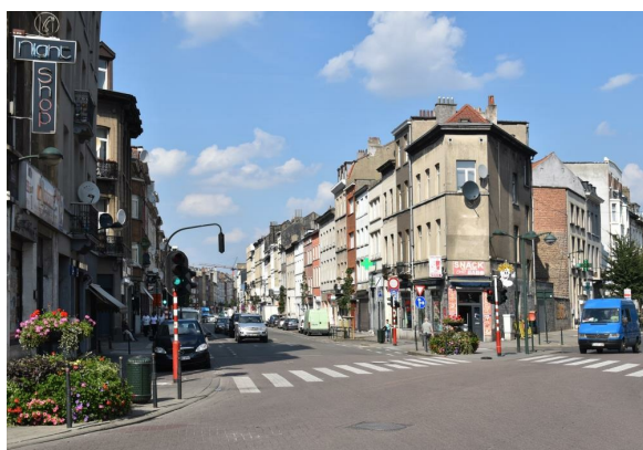
Chaussée d'Anvers, vue vers le nord depuis la rue Masui, 2016