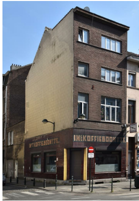
Chaussée d'Anvers 441, 2016