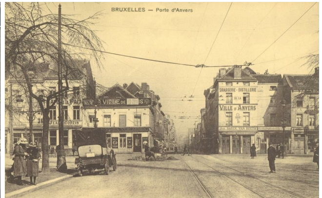
Vue de la chaussée d'Anvers depuis le boulevard Baudouin, (coll. Belfius Banque © ARB-SPRB)