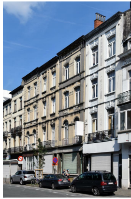
Chaussée d'Anvers 377 à 383, 2016