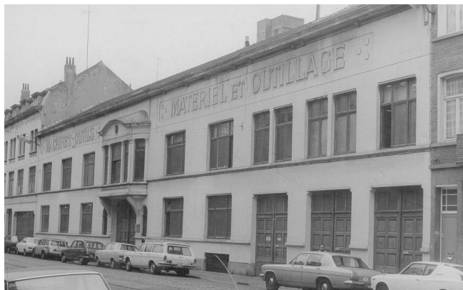
Chaussée d'Anvers 315-317, les Établissements Honoré Demoor et C ie en 1975, (© KIK-IRPA Brussels, Belgium)