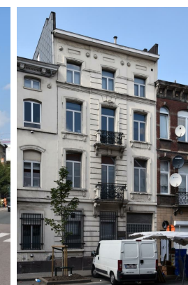
Chaussée d'Anvers 278, 2016