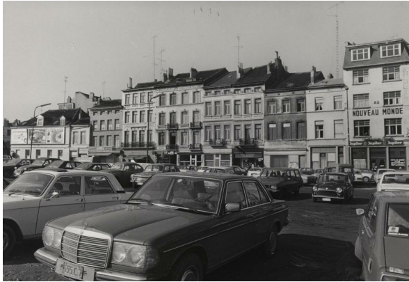
Chaussée d'Anvers 2 à 20 en 1979