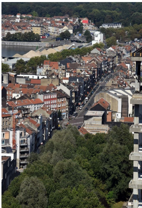
Chaussée d'Anvers, vue vers le nord depuis le World Trade Center, 2016