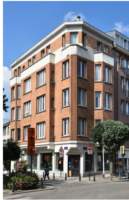
Chaussée d'Anvers 68, 2016