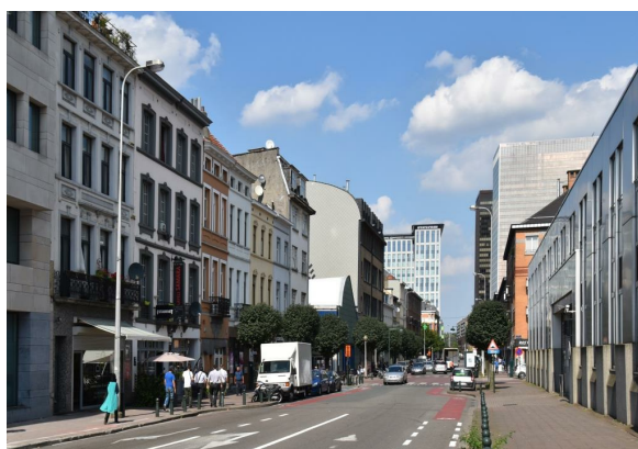
Chaussée d'Anvers, vue depuis le boulevard Baudouin, 2016

VAN DER ELST, W., «De verdwenen filmzalen van Laken», LACA Tijdingen , 4, année 16, juin 2005.