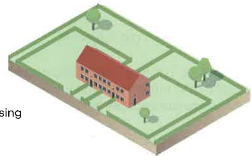
● Aaneengesloten woning