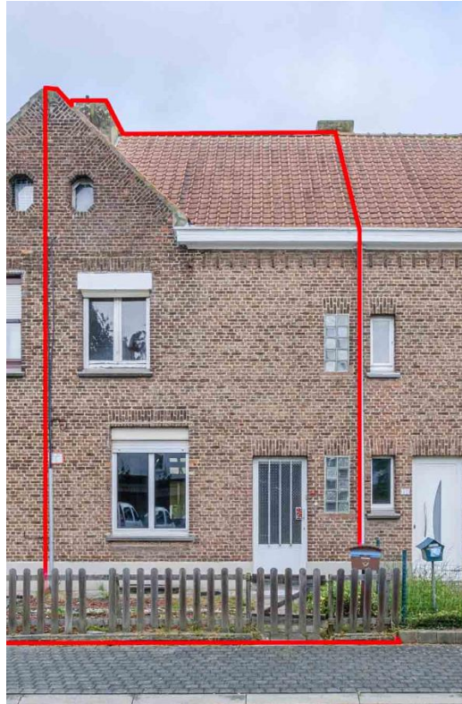
KOOP 14 – ABEELSTRAAT 54