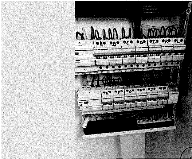
( Inwendige foto )