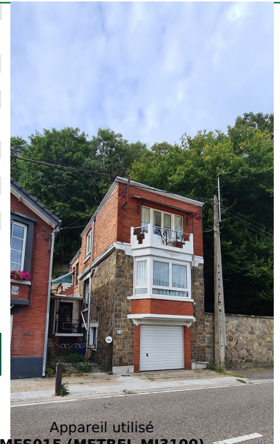
Appareil utilisé MES015 (METREL MI3100)